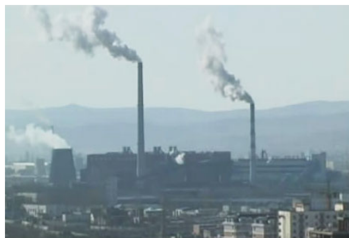
Улаанбаатар хотын цахилгаан станц

Телевизийн "Халуун сэдэв" цуврал нэвтрүүлгийн хүрээнд уг төслөөс 5 дугаар сарын 4-ний өдрөөс эхлэн долоо хоногийн туршид ахуйн эрчим хүчийг хэмнэх асуудалтай холбоотой телевизийн нэвтрүүлгийг гаргав. Уг нэвтрүүлгийг МҮОНТ-ээр 3 удаа, UBS телевизийн сувгаар 4 удаа давтаж нэвтрүүллээ. Энэхүү нэвтрүүлгийн агуулгыг УБ Дулааны сүлжээ компани ЭЗБШӨЧ төслийн багтай хамтран гаргаж, ивээн тэтгэсэн юм.