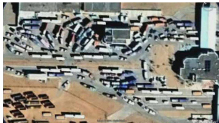
Google-д харуулсан Замын-Үүд дэх ачаа тээврийн бөөгнөрлийн газрын зураг, 2008 оны зун

Гадаад худалдааг хөнгөвчлөх үзүүлэлтээр Монгол улс дэлхийн 181 орноос 156-д оржээ. Гол хүнсний бүтээгдэхүүнийхээ 70 хувь, аж үйлдвэрийн барааны 80 хувь, 100 хувь техник тоног төхөөрөмж, түлш шатахуун импортоор оруулдаг Монгол улсын хувьд энэ үзүүлэлтийг анхаарах шаардлагатай. Тус улсын нийт импортын 60-70 хувь нь БНХАУ-тай залгаа Замын -Үүдийн боомтоор орж ирдэг аж.