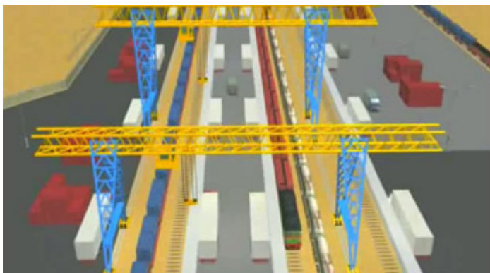
ТХХТ-ийн хэлбэрээр байгуулах шилжүүлэн ачилтын байгууламжийн дижитал дүрс

Үүдэд төр, хувийн хэвшлийн түншлэлийн (ТХХТ) хэлбэрээр байгуулах боломжийн талаар тайлбар хийв.